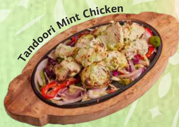
Tandoori Mint Chicken