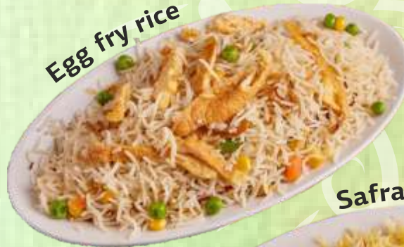
Egg fry rice