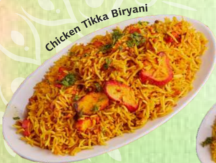
Chicken Tikka Biryani

Boneless fresh baby lamb in small pieces cooked with aromatic Indian basmati rice flavored with herbs, spices and turmeric