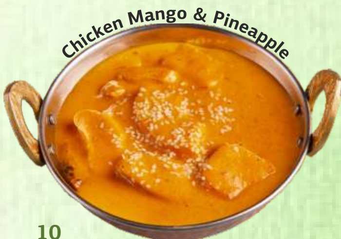
Chicken Mango & Pineapple

Boneless fresh chicken breast fillet marinated in a mix of selected spices, cooked in a traditional Tandoor oven and then cooked in a light sauce of tomato and milk cream, spices and butter