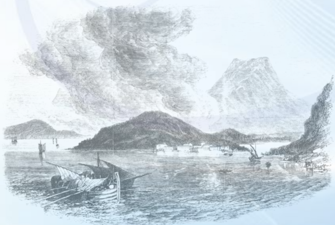
ERUPTION OF A SUBMARINE VOLCANO AT SANTORIN, GREEK ARCHIPELAGO.