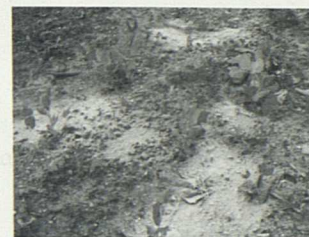
Στάχτη στις ρίζες των μπιζελιών, φωτογρ. Αικ. Πολυμέρου-Καμπλάκη