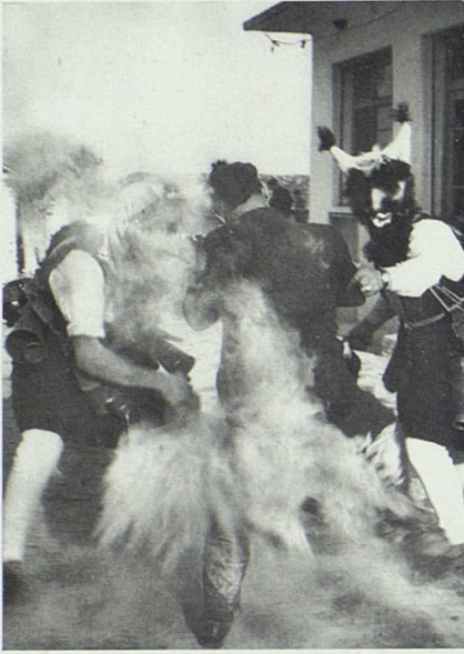
Κτυπήματα με τον ντρομπά (σακκούλι με στάχτη). Πειράγματα των διαβατών από τους μεταμφιεσμένους. Φωτογραφικό Αρχείο Κέντρου Λαογραφίας, Καλή Βρύση Δράμας, 1965, φωτογρ. Γεωργ. Ν. Αικατερινίδης.