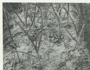
Στάχτη στις ρίζες των κρεμμυδιών

Η εστία ως κομβικό σημείο επικοινωνίας για τα μέλη της οικογένειας αποτελεί τον χώρο όπου πραγματοποιούνται οι περισσότερες εθιμικές τελετουργίες σε σημαντικές διαβατήριες στιγμές στον κύκλο του χρόνου, όπως είναι το δωδεκάημερο των Χριστουγέννων-Φώτων για τον χριστιανικό κόσμο. Έτσι, το σημείο αυτό της οικίας είναι κατά το