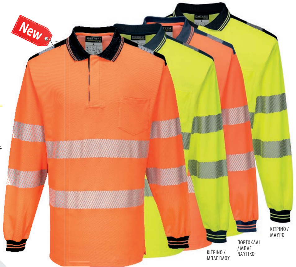
ΠΟΡΤΟΚΑΛΙ / ΜΑΥΡΟ

55% Βαμβάκι, 45% Πολυεστέρας, Πλεχτό 175g Πορτοκαλί / Μαύρο, Κίτρινο / Μπλε βαθύ, Πορτοκαλί / Μπλε Ναυτικό, Κίτρινο / Μαύρο, S-5XL Αναγνωρισμένος Ευρωπαϊκός Κοινοτικός Σχεδιασμός