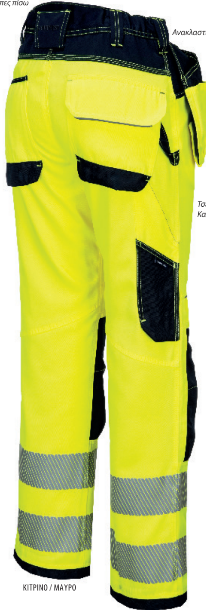
ΚΙΤΡΙΝΟ / ΜΑΥΡΟ