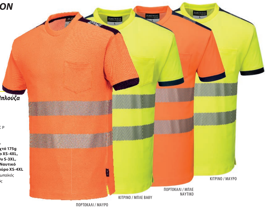
ΠΟΡΤΟΚΑΛΙ / ΜΑΥΡΟ