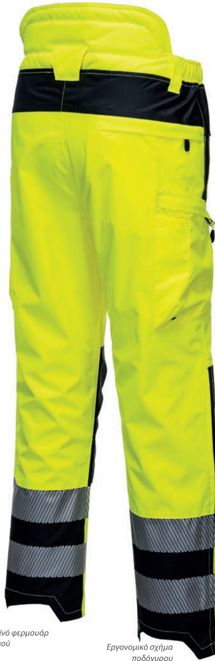
Πλαϊνό φερμουάρ ποδιού