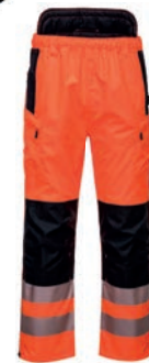
ΠΟΡΤΟΚΑΛΙ / ΜΑΥΡΟ