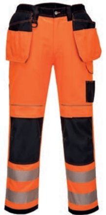
ΠΟΡΤΟΚΑΛΙ / ΜΑΥΡΟ