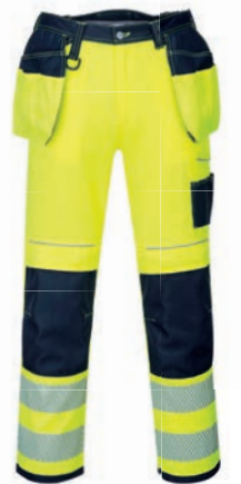
ΚΙΤΡΙΝΟ / ΣΚΟΥΡΟ ΝΑΥΤΙΚΟ