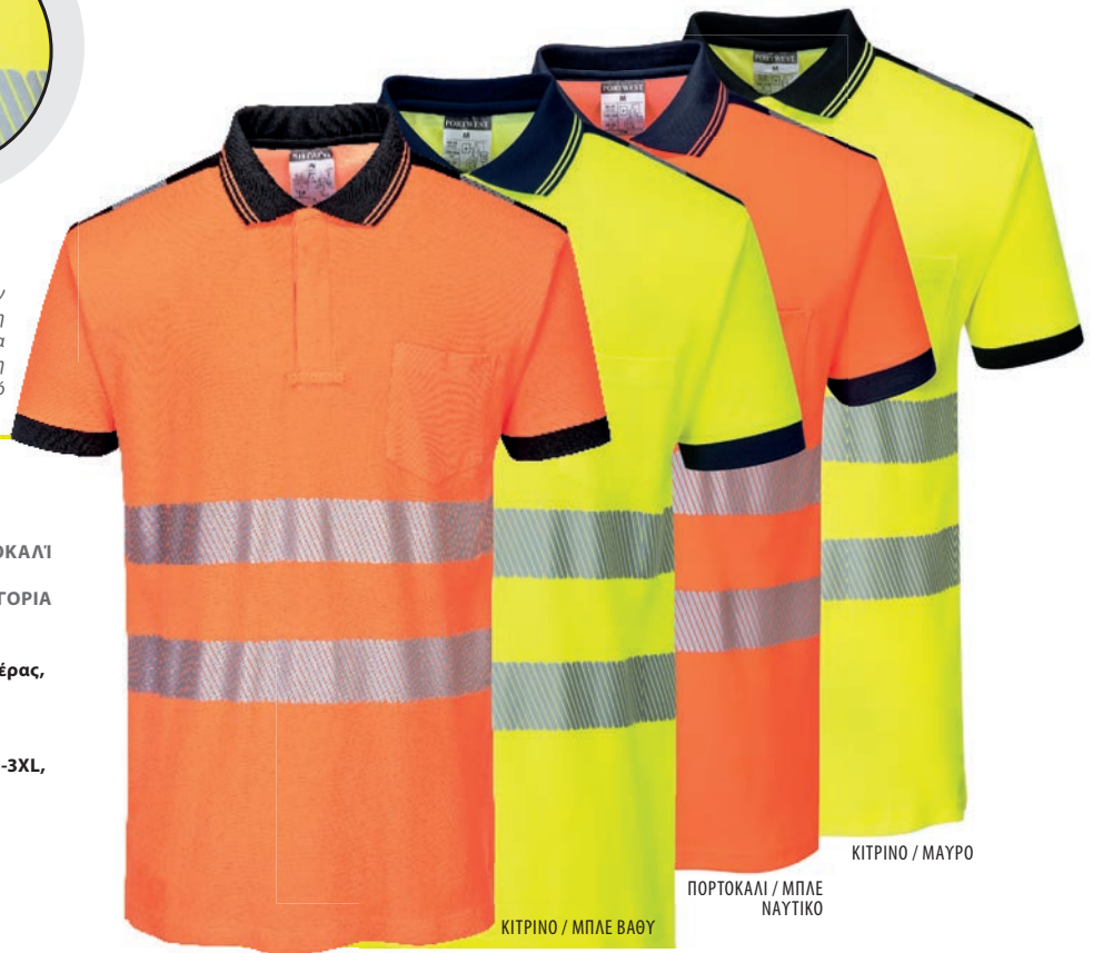
ΠΟΡΤΟΚΑΛΙ / ΜΑΥΡΟ

55% Βαμβάκι, 45% Πολυεστέρας, Πλεχτό 175g Πορτοκαλί / Μαύρο XS-4XL, Κίτρινο / Μπλε βαθύ S-3XL, Πορτοκαλί / Μπλε Ναυτικό S-3XL, Κίτρινο / Μαύρο XS-4XL Αναγνωρισμένος Ευρωπαϊκός Κοινοτικός Σχεδιασμός