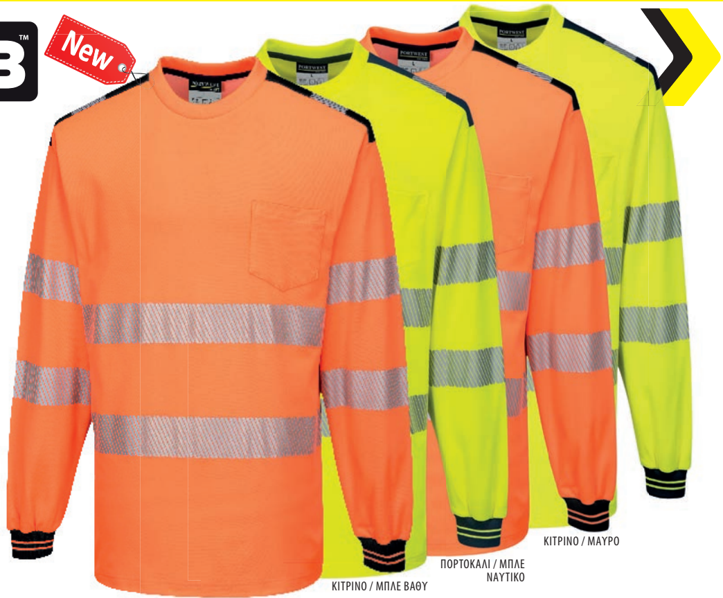
ΠΟΡΤΟΚΑΛΙ / ΜΑΥΡΟ