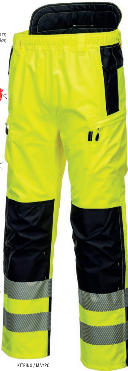
ΚΙΤΡΙΝΟ / ΜΑΥΡΟ